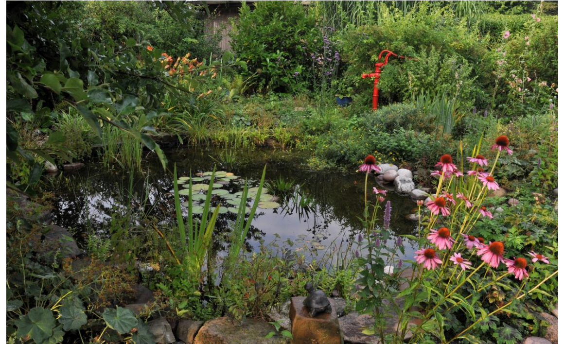
Vilde og tamme planter, vandhuller og skønhed kan forenes