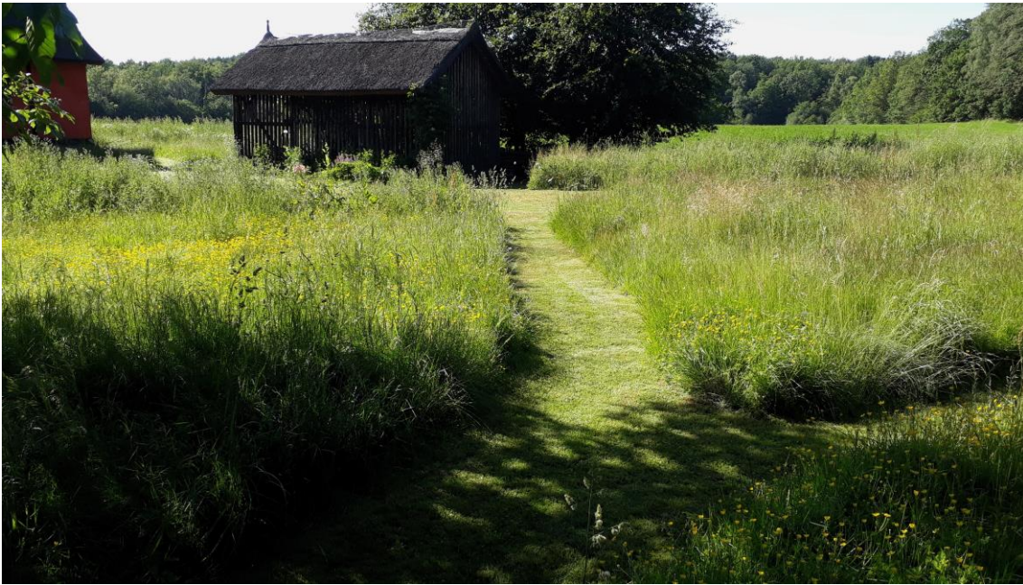
Højt græs og stier giver plads til planter, dyr og mennesker